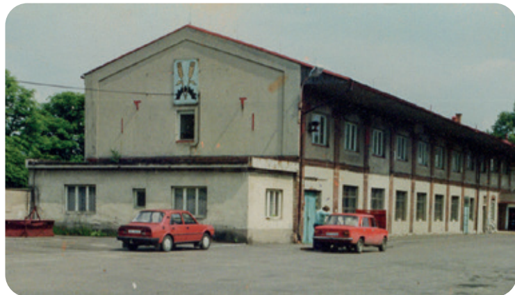
Začátky v pronajatých prostorách v Nádražní ulici v Týništi nad Orlicí

počátkem dubna letošního roku oslavila společnost AGRICO, s.r.o. 30 let od svého založení, a proto mi dovoluje, abych se s vámi podělil o některá fakta a tak trochu se poohlédl do historie.