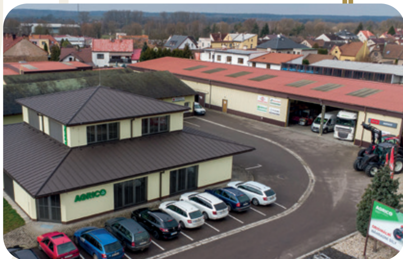
Zrekonstruovaná moderní administrativní budova v Čapkově ulici

V roce 2017 jsme aktualizovali logo, aby odpovídalo současné moderní filozofii firmy.