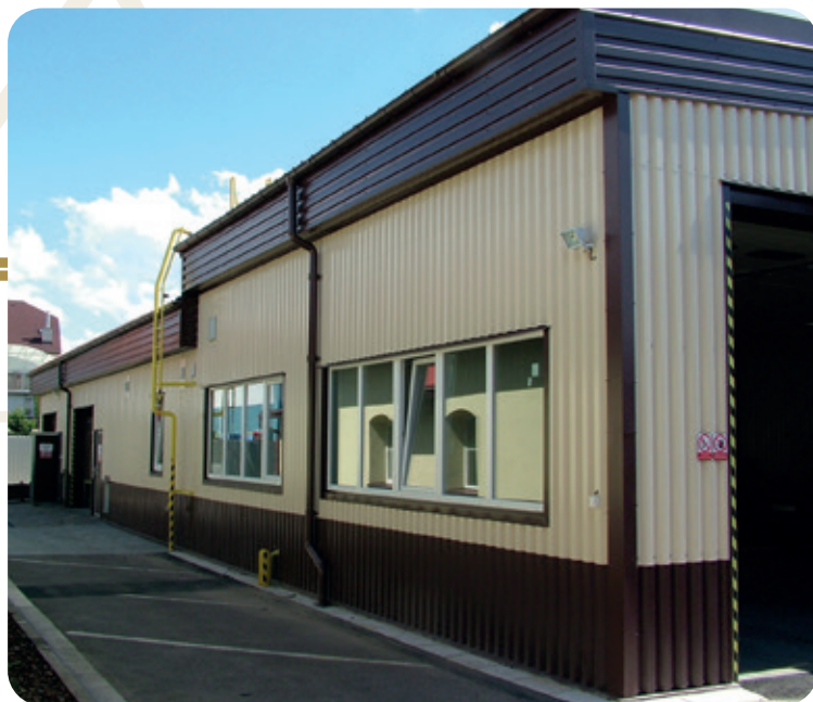
Nová montovaná hala postavená na místě původních starých budov

Protože se firma dynamicky rozvíjela, rozhodli jsme se na podzim roku 2008 k demolici poslední (zadní) části starých budov v areálu a na jaře roku 2009 jsme vybudovali další montovanou halu LLENTAB, do které jsme umístili druhou servisní dílnu zemědělské techniky a traktorů, mycí box, sklad olejového hospodářství, sklad pneumatik a další sklad náhradních dílů. Od června 2010 jsme v těchto prostorách spustili provoz pneuservisu zemědělských pneumatik.