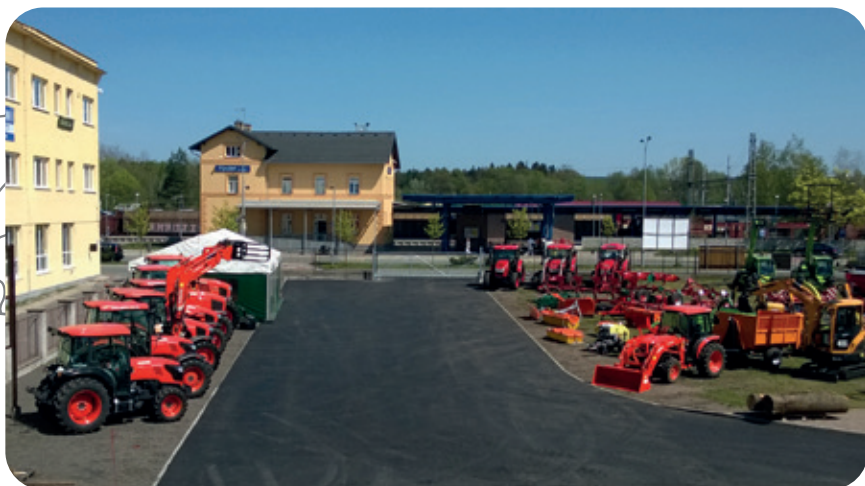
Nově vybudovaný asfaltový výjezd z areálu v Čapkově ulici

Za zmínku také stojí období března až dubna 2018 , kdy se podařilo v areálu v Čapkově ulici vybudovat další asfaltovou komunikaci s druhým výjezdem z obchodního areálu, což oceňují především řidiči kamionů, kteří zajedou do sídla firmy.