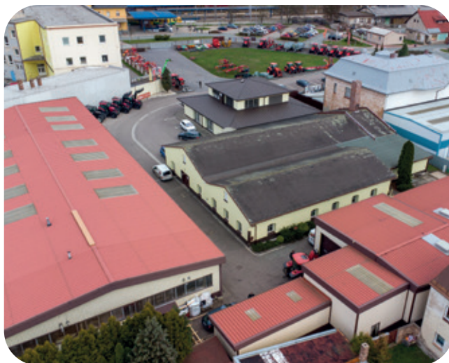
Pohled na areál firmy, kde jsou vidět skladovací a servisní haly

Roky 2020 a částečně i 2021 byly asi pro všechny z nás spojeny s pandemií Covid-19. Pravidelně jsme se testovali a firma fungovala v rámci pravidel stanovených vládou České republiky. Bohužel nás všechny zásadně zasáhly události, které následovaly po ústupu pandemie. Byla to špatná dostupnost některých finálních výrobků i náhradních dílů, ale především výrazný nárůst cen u většiny našich dodavatelů. Za poslední z významných historických událostí a investic lze považovat období květen až září 2021, kdy se nám podařilo zrekonstruovat a zmodernizovat plynovou kotelnu a administrativní budovu v sídle firmy v Čapkově ulici.