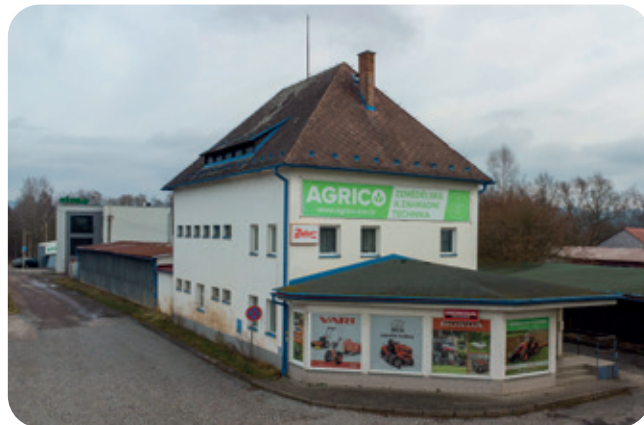
Areál střediska v Červeném Kostelci