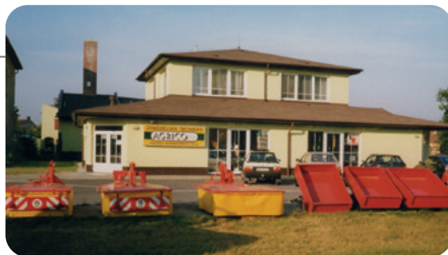
Nově zrekonstruovaný obchodní areál v Čapkově ulici v roce 1996 (naproti nádraží ČD)

Obchodu se dařilo, stali jsme se i mimo jiné významným dodavatelem náhradních dílů na sklízecí mlátičky Fortschritt (E-512, 516, atd.). Ruku v ruce se s prodejem náhradních dílů, zemědělské i zahradní a později i komunální a lesní techniky, rozvíjely také servisní služby. Rozhodující obchodní strategií a filozofií pro nás vždy byl a bude spokojený zákazník. To znamená, že na jakoukoliv techniku, kterou prodáváme, zajišťujeme také servis a vedeme široký sortiment náhradních dílů. Postupně se z malé privátní firmičky o pár zaměstnancích začala etablovat společnost, se kterou musela konkurence v regionu Královhradeckého a Pardubického kraje počítat.