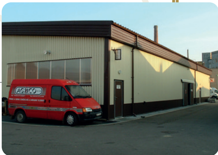
Nová skladovací a servisní hala

Srpen 2013 se stal dalším důležitým mezníkem v historii firmy. Protože se obchod se zahradní a komunální technikou rychle rozvíjel, bylo třeba jej umístit do větších a moderních prostor. Tím se stal areál bývalého autosalonu s restaurací na adrese Voklik 976 v Týništi nad Orlicí. Areál má strategické místo hned vedle silnice č. 11 (HK-Ostrava). Zahradní a komunální technika je zde vystavena na ploše 300 m 2 . K dispozici je také servis a skladovací prostory pro náhradní díly.