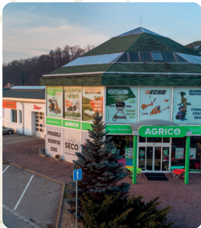
Nové centrum zahradní a komunální techniky, na místě bývalého autosalonu

Obchodu se zemědělskou a zahradní technikou se dařilo více a více, proto jsme v roce 2000 vybudovali novou skladovací a servisní halu. Skladovací prostory o rozloze 520 m 2 jsme vybavili regálovými systémy a servis o rozloze 152 m 2 potřebným servisním vybavením. O 6 let později, tedy v roce 2006 , jsme servisní halu rozšířili o dalších 120 m 2 , abychom byli schopni ještě lépe uspokojit potřeby našich zákazníků.