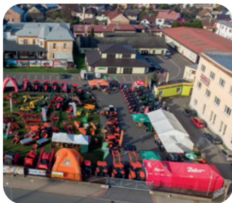
Letecký pohled na areál firmy v Čapkově ulici.